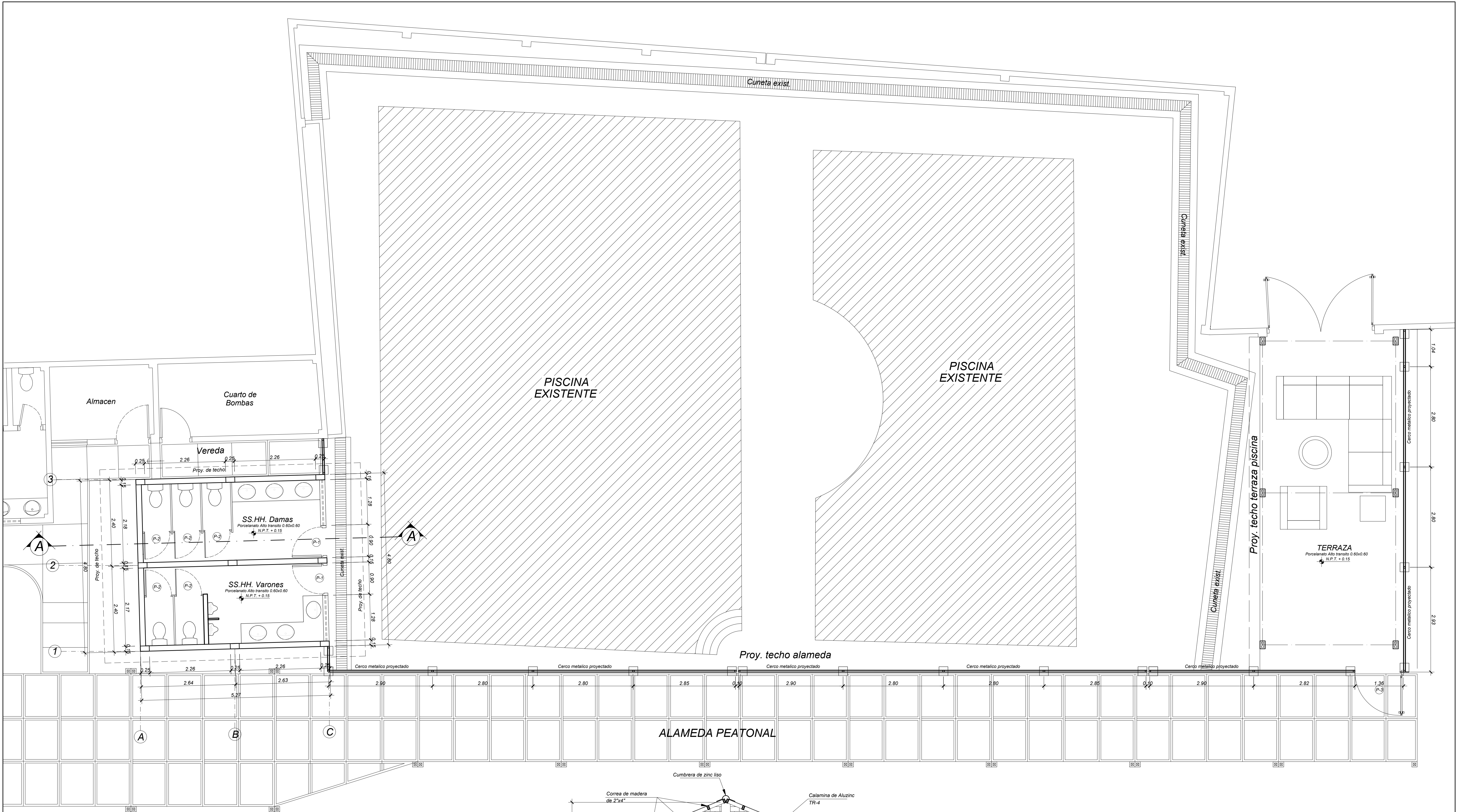
PLANTA GENERAL DE SS.HH Y TERRAZA - PISCINA Esc. 1/50